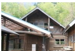
フォレスハウス外観