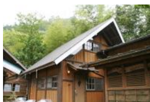
グリニストハウス外観