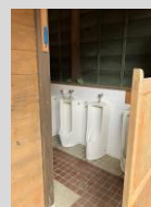
トイレ・シャワー施設(共用)