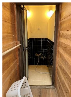
←シャワーブース ↓トイレ外観